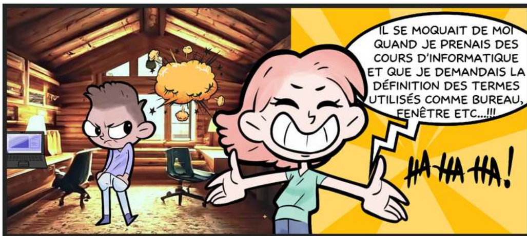
Créé avec l'application BoF développée par la {BnF}